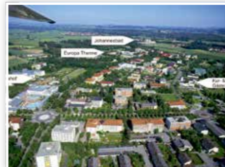
... und heute