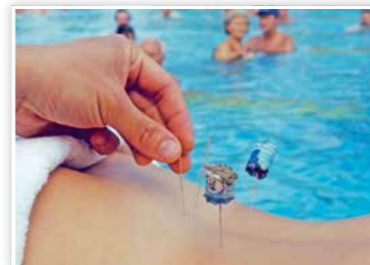
Gesundes Doppel: China-Medizin und Thermalbaden