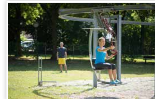
Wirksames Rückentraining: Seilbahn im BewegungsParcours