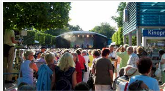
Publikumsmagnet: das Veranstaltungsangebot