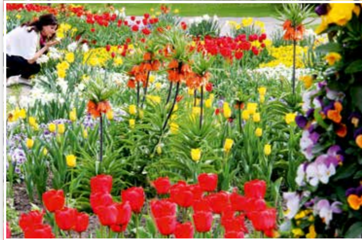
Blühende Visitenkarte: der Kurpark