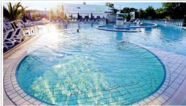
Europa Therme – Aussenbecken am Tag ...