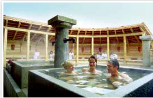
Saunahof: Wellness in historisches Kulisse