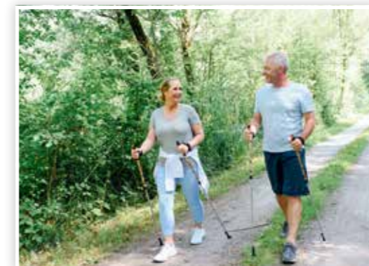
Kreislauf-Kur: Nordic Walking