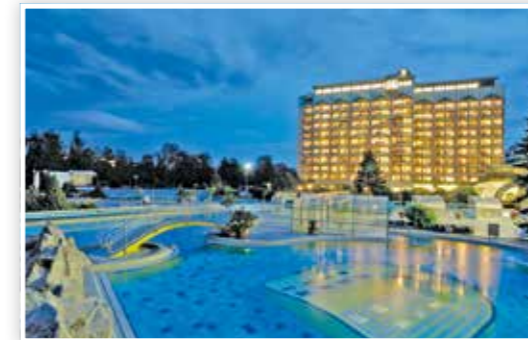
Abendstimmung im Johannesbad