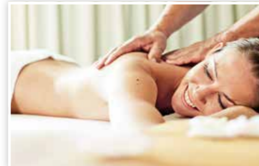
Massagen beflügeln Körper und Seele