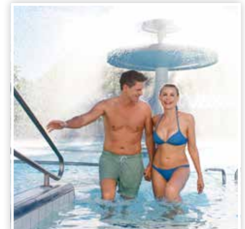
... und in der Therme Eins