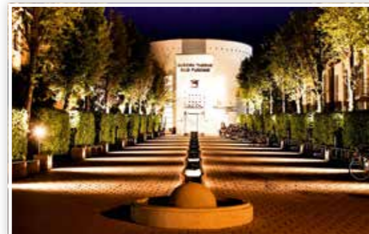
Eingang zur Europa Therme