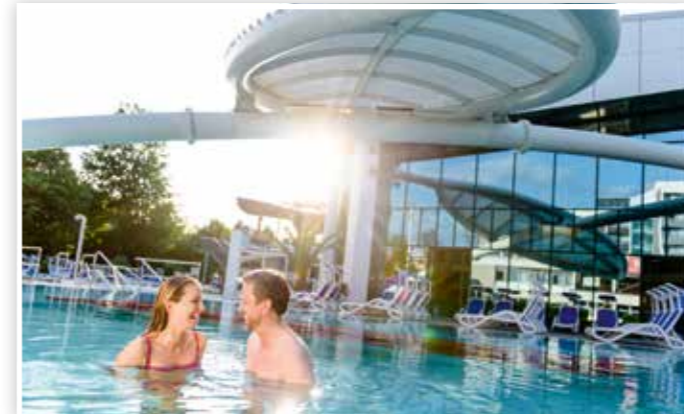
... in drei komfortablen Thermen (hier: Europa Therme)