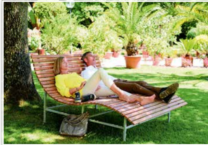
Entspannungseiseln im Grünen