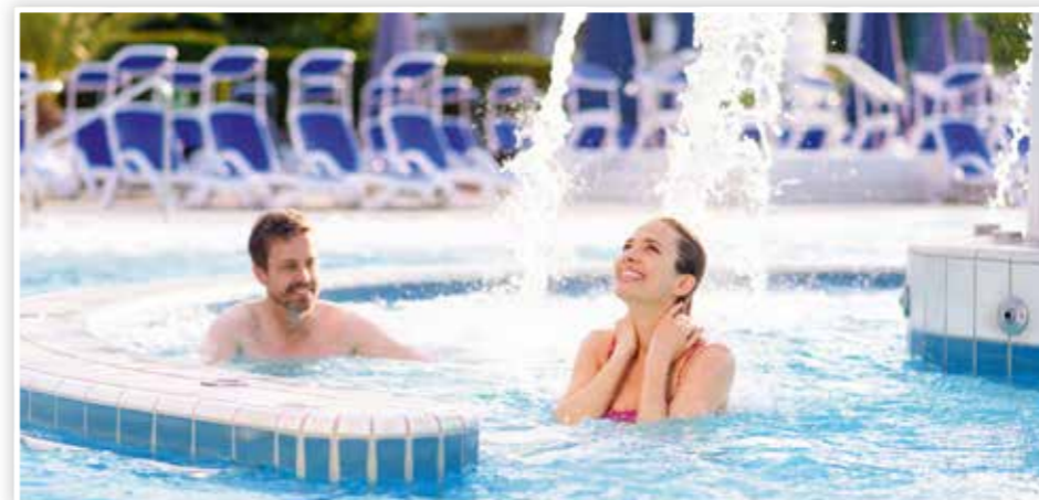
Belebende Attraktion: Thermalwasser-Regen in der Europa Therme ...