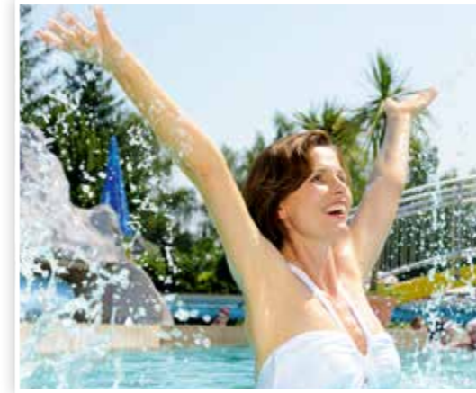
Tropische Badegefühle im Sommer