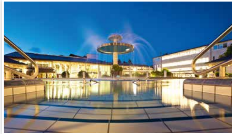
Die Therme Eins im Abendlicht