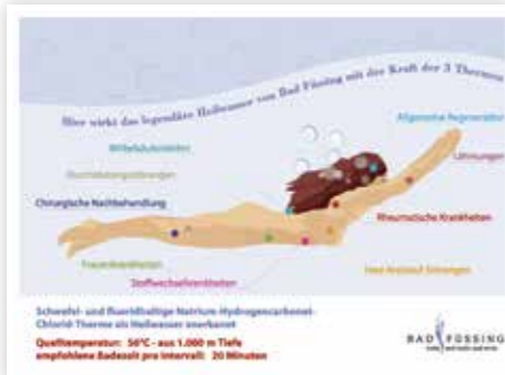
Die legendäre Heilwirkung der Thermen