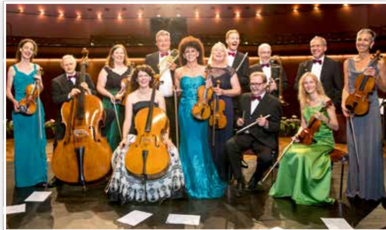
Über 50 Jahre Musik in Bestform: das Profi-Kurorchester