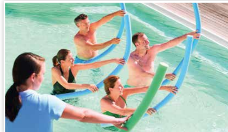
Aquafit-Training in den legendären Thermen