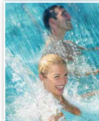
Erfrischender Thermal-Badespass ...