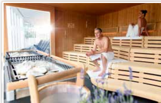
Saunen in der Europa Therme