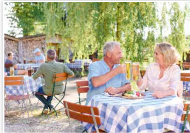
Urig bayerische Gemütlichkeit zwischen den Thermen