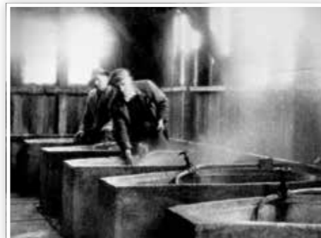
Europas Kurort Nummer 1 vor 70 Jahren ...