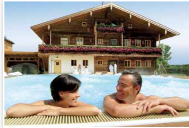
Der Saunahof, die 5-Sterne-Saunawelt ...