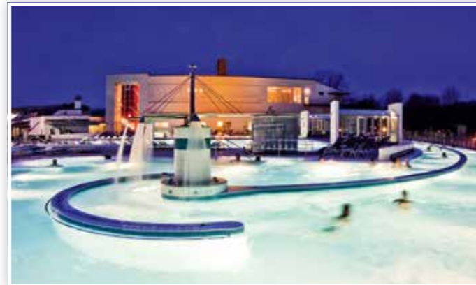
... und am Abend