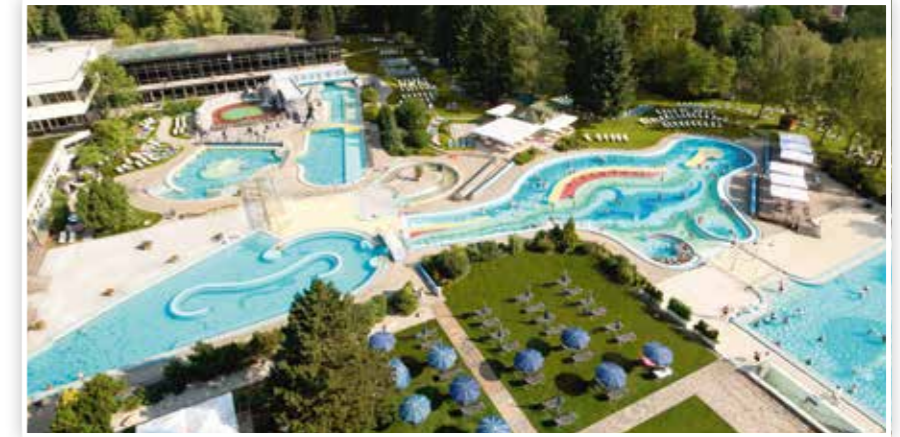
Europas weitläufigste Thermenlandschaft (Teilansicht)